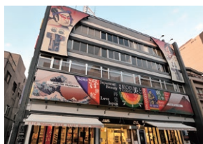
アミューズミュージアムは布文化と浮世絵の美術館、和のセレクトショップ、ライブスペースが一体となった複合アートビルです。