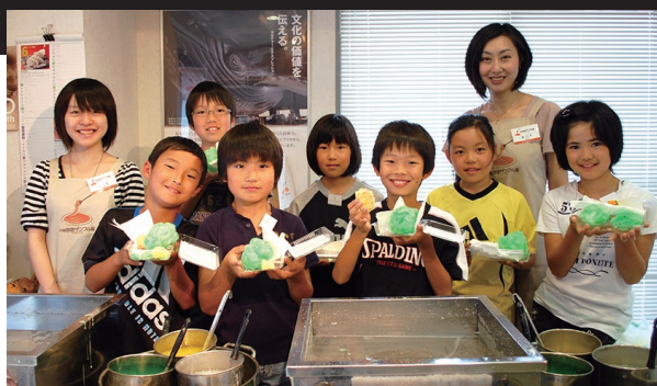
ものづくりの楽しさを仲間と共有できる食品サンプル製作体験は、学校、職場、趣味のサークルなどのレクリエーションの場としても好評です。