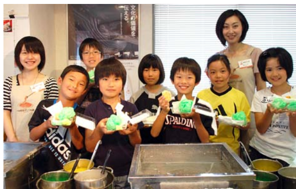
ものづくりの楽しさを仲間と共有できる食品サンプル製作体験は、学校、職場、趣味のサークルなどのレクリエーションの場としても好評です。