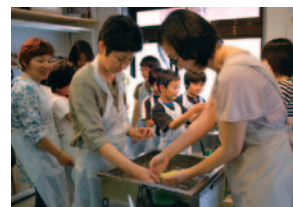
スタッフが実演丁寧に指導しますので、初めての方も楽しく体験できます。