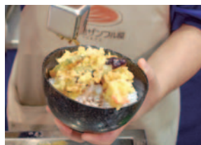
新メニューとして、浅草の定番メニューの「天井」が登場。