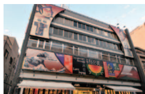
アミューズミュージアムは布文化と浮世絵の美術館、和のセレクトショップ、ライブベースが一体となった複合アートビル。